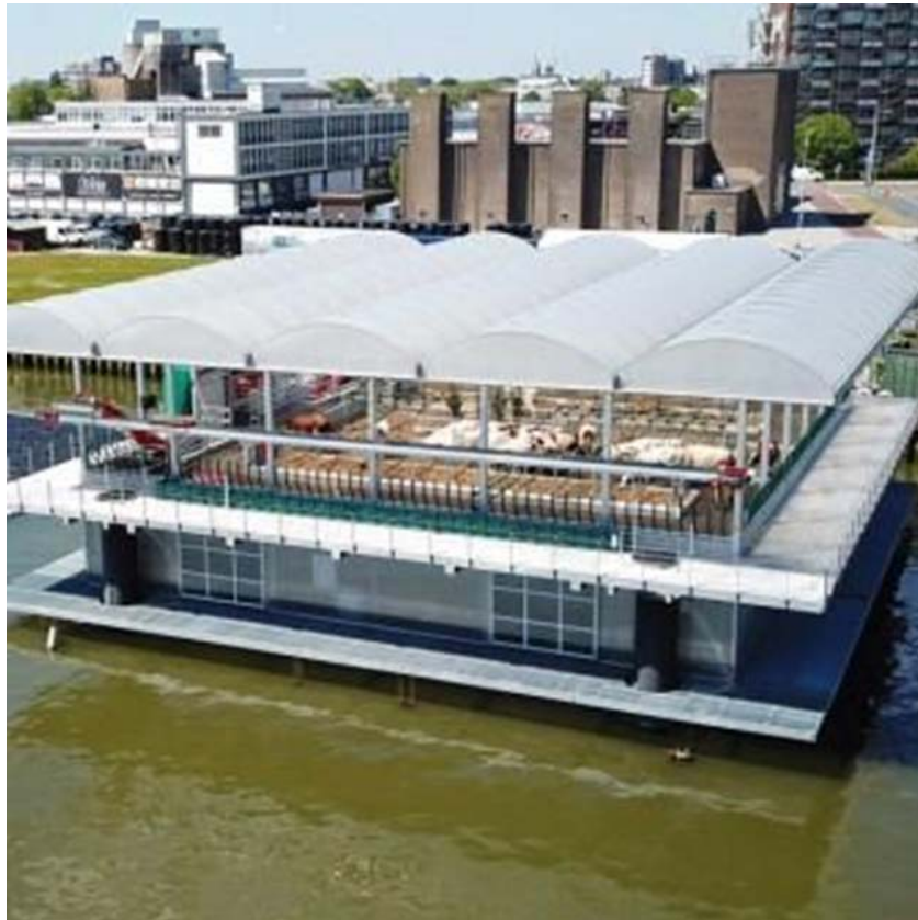
Granja flotante de vacas en el puerto de Róterdam. Holanda

Nos resulta difícil imaginar la utilización de seres sensibles como son los animales, integrados en un mundo tan antinatural y ligado exclusivamente a la motivación crematística.