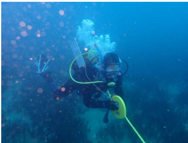
Cinta mètrica durante el muestreo