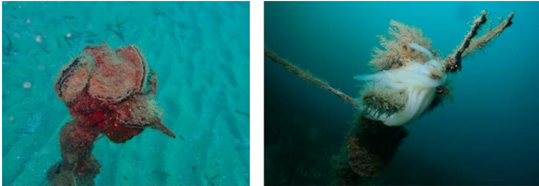
Ostras y huevos de calamar en las barras que marcan el límite de la estación

de las zonas de herbazales, considerados muchos de ellos residentes en la pradera de Mataró.