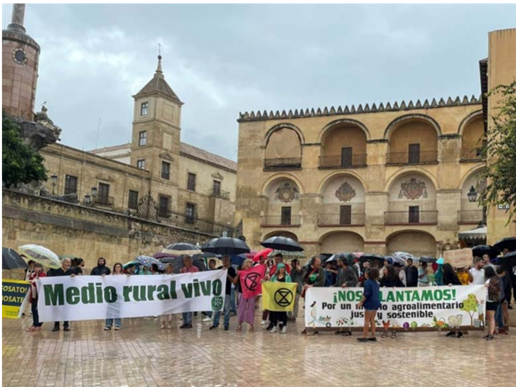
Concentración en Córdoba frente a la reunión de Ministros de Agricultura.