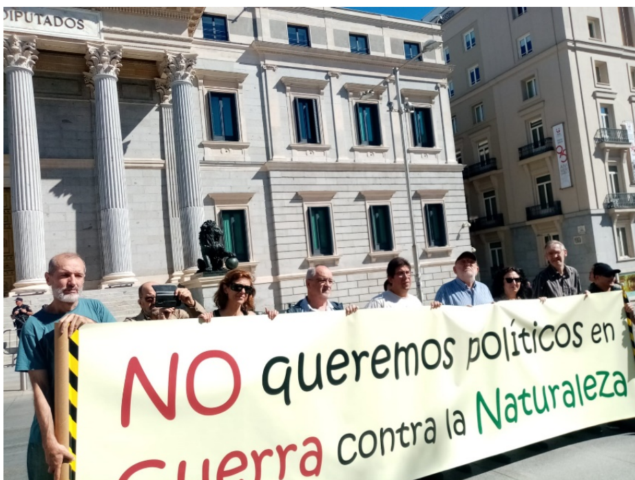
Concentración ante el Congreso de los Diputados (Madrid).