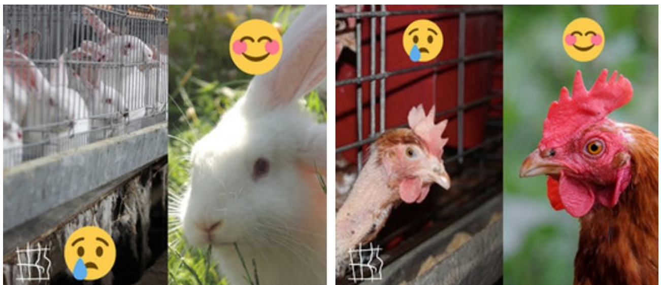
Imágenes correspondientes la iniciativa “No Más Jaulas”.