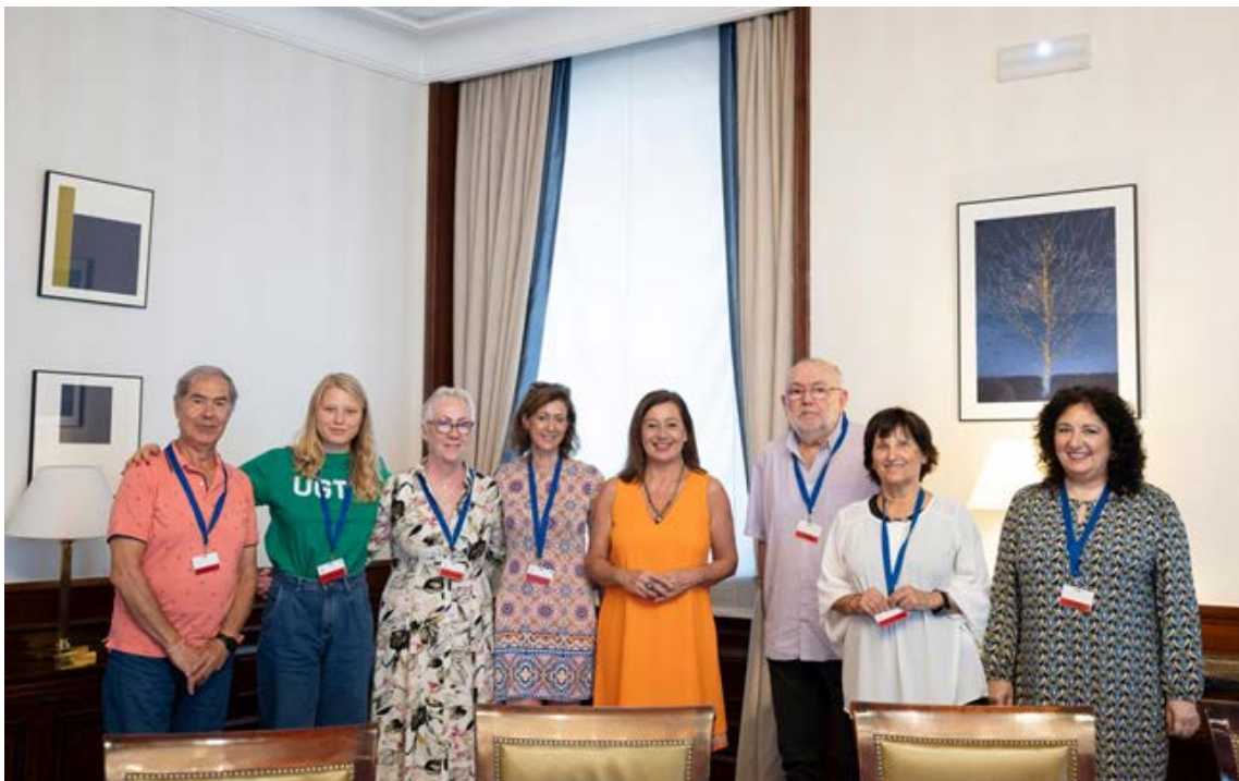
Francina Armengol recibe a representantes del Abrazo al Agua.

Francina Armengol, presidenta del Congreso, recibió el día 20 a una pequeña comitiva en representación de las distintas entidades y escuchó sus peticiones en un encuentro cordial. La dirigente balear reiteró seguidamente el compromiso de la Cámara a través de una publicación en las redes sociales: “Hoy me he reunido con ellos para reiterarles el compromiso del @Congreso_Es para favorecer durante esta legislatura el diálogo y la pedagogía ante la emergencia climática, una amenaza reconocida por la ONU que solo podremos combatir protegiendo y potenciando nuestros enclaves naturales y ecosistemas urbanos. ¡Hagámoslo posible!”.